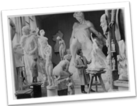
Carl Eldh i ateljén, 1920-tal.

Carl Eldh (1873–1954) var verksam som skulptör i Stockholm 1904–1954. Han utbildade sig i Stockholm och likt många samtida konstnärer i Paris. Under sin livstid fick Eldh många uppdrag bland annat som porträttör och utförare av monument. Hans verk finns i stadsmiljöer, parker, på fasader och i privata och offentliga samlingar.